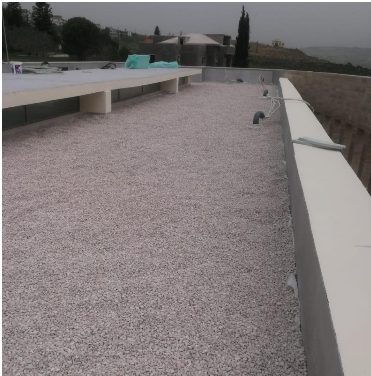
Milano, Maggio 2022 – MPM Engineering