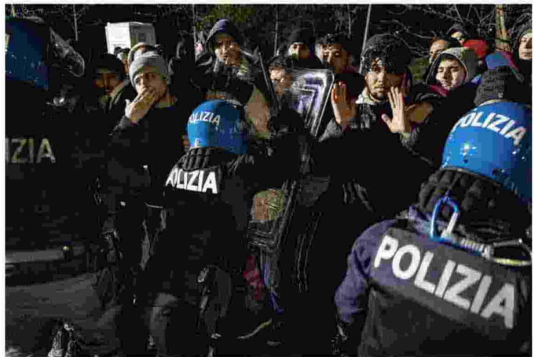
Un'immagine degli scontri avvenuti in via Cagni

I richiedenti asilo potranno accedere con appuntamento sulla piattaforma "Prenotafacile" della polizia. Previsti "corridoi" digitali speciali per donne incinte e persone superiori ai 60 anni grazie a un accordo con Avsi