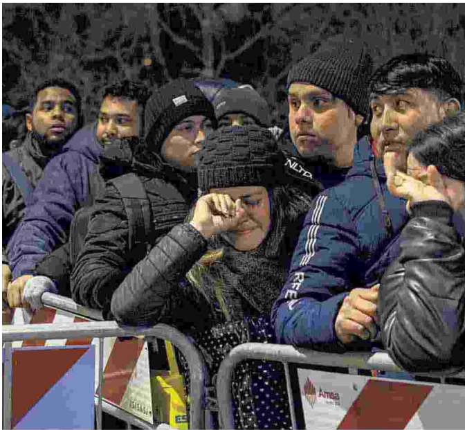
▲ In coda per il permesso

La fila dei migranti davanti agli uffici della questura in via Cagni: negli ultimi mesi nelle notti tra domenica e lunedì si è ripetuta questa scena