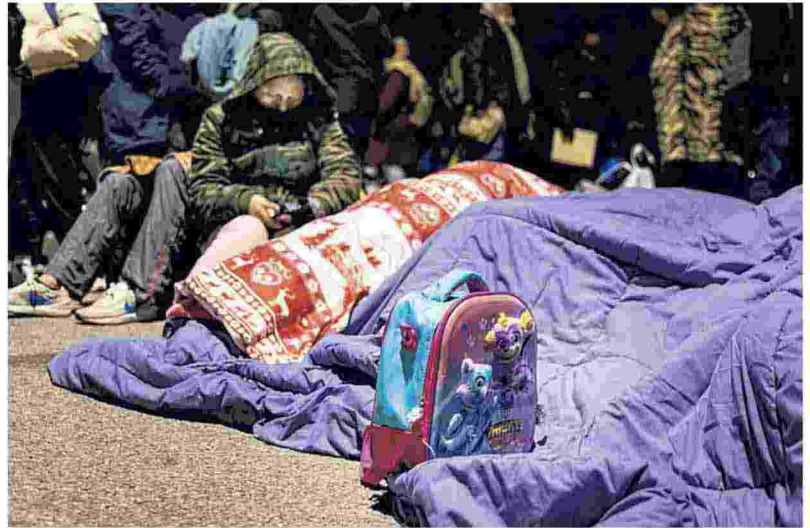
▲ Gli accampamenti notturni in via Cagni non si vedranno più