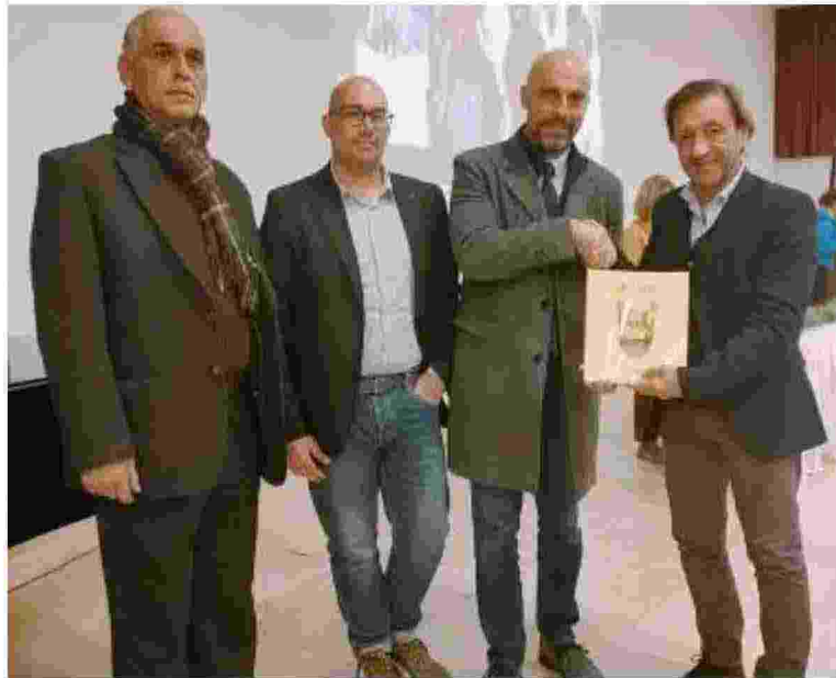
L'incontro avvenuto in Palestina con sindaco e presidente del consiglio comunale

Si è conclusa la visita istituzionale della delegazione del Comune di Comacchio nei territori di Beit Sahour e Betlemme, con i quali il Comune ha in essere due distinti Patti di Amicizia e con cui ha dato vita nel 2018 al progetto denominato 'Specialitaly'. 'Specialitaly' è un progetto di cooperazione internazionale finanziato da dall'Agenzia italiana per la Cooperazione allo Sviluppo con capofila il Comune di Comacchio e una rete di ventisei partner pubblici e privati italiani e palestinesi tra cui Avsi , Consorzio Si scs, aps Santa Caterina da Siena, Comune di Betlemme, Comune di Beit Sahour, Comune di Chioggia, Comune di Lavello e molteplici realtà del terzo settore e istituti scolastici, conclusosi lo scorso anno. L'obiettivo del progetto è promuovere l'offerta turistica nei municipi di Betlemme e Beit Sahour, sviluppando attività di accoglienza innovative per l'area (albergo diffuso) e servizi di ristorazione di qualità attraverso la trasmissione di competenze (corsi di formazione) nell'ambito del turismo e della ristorazione. Il progetto ha riservato una particolare attenzione all'inclusione lavorativa di giovani e adulti in difficoltà. In occasione della cerimonia di sottoscrizione del Patto di Amicizia